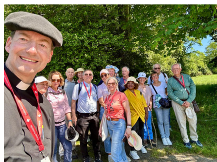
Marche jusqu'à Bartrès avec les Veveysans.